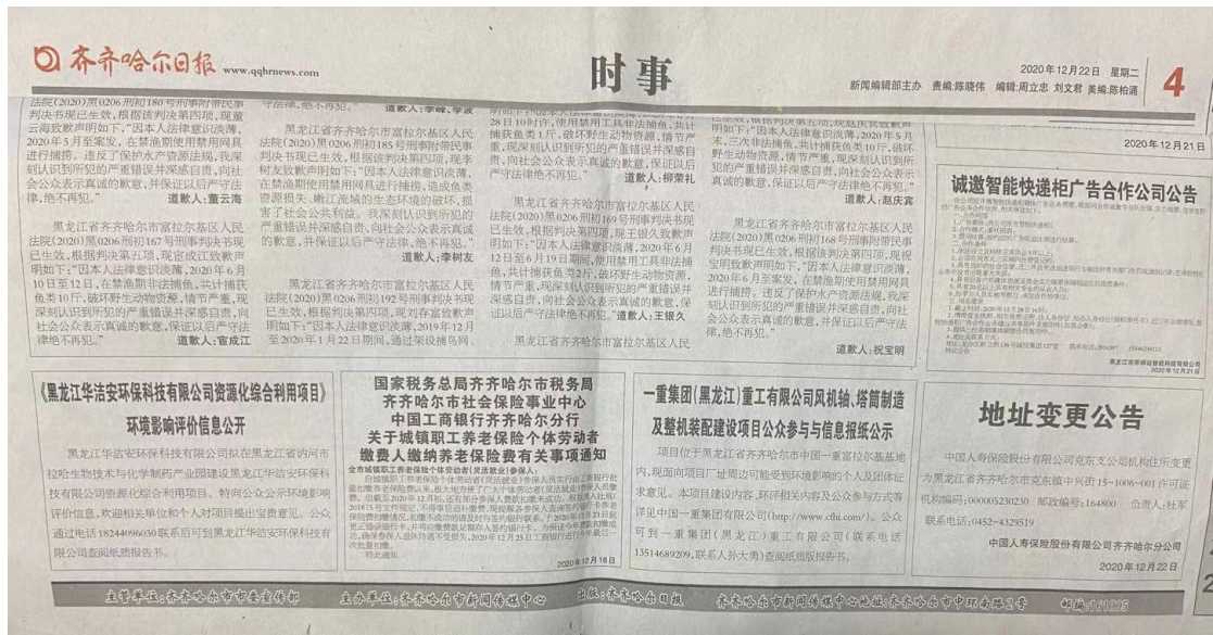
图 3-2 第一次报纸信息公示截图