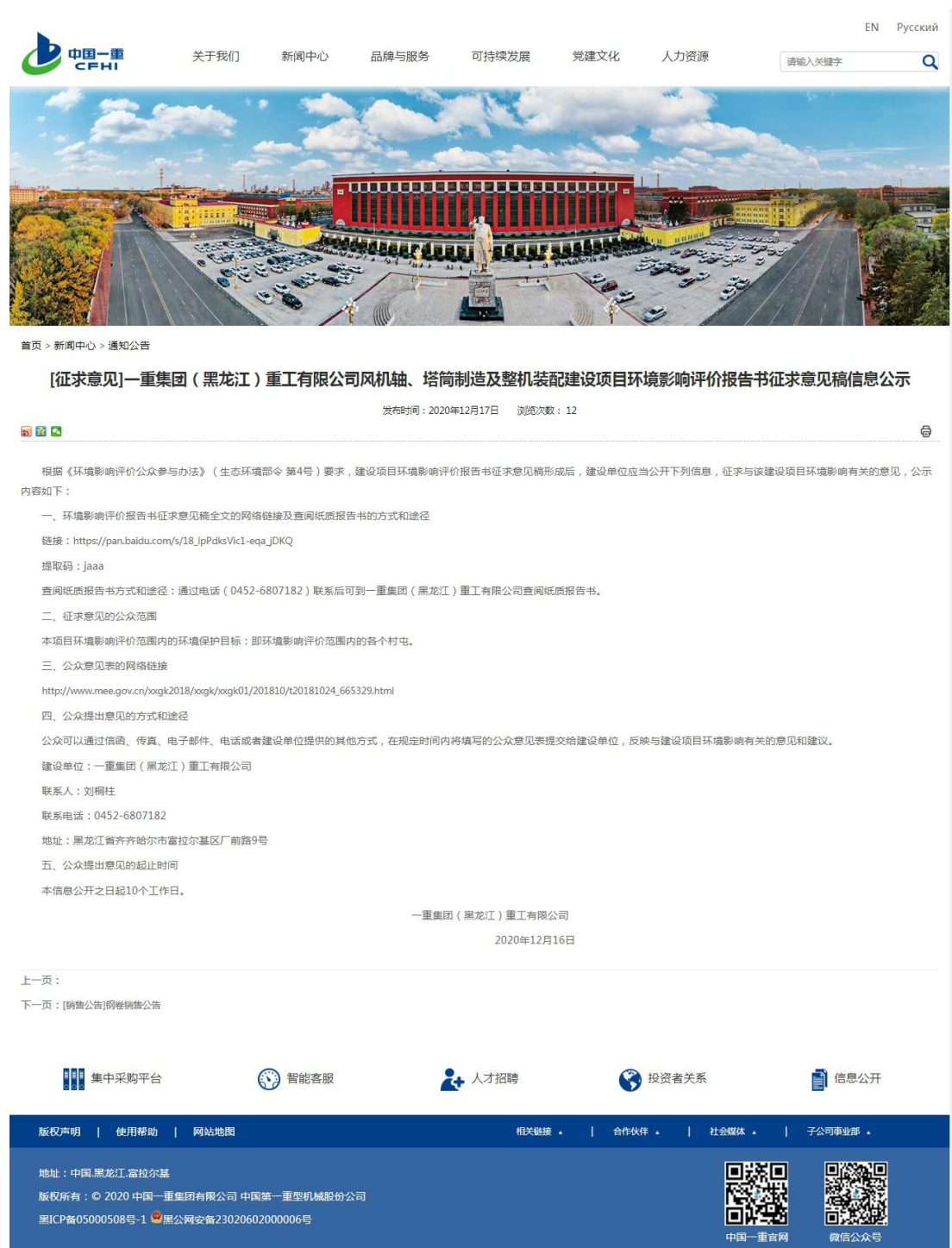
图 3-1 征求意见稿网络公示截图