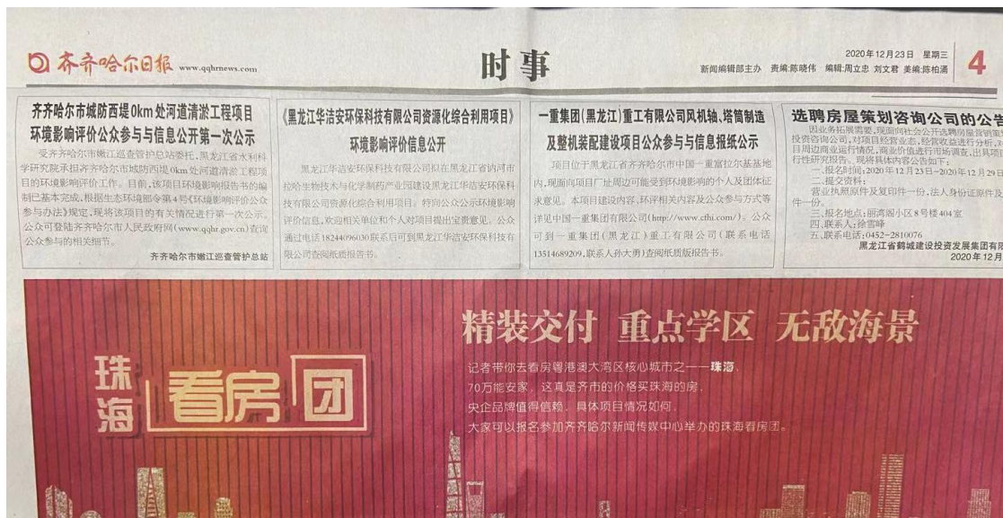
图 3-3 第二次报纸信息公示截图